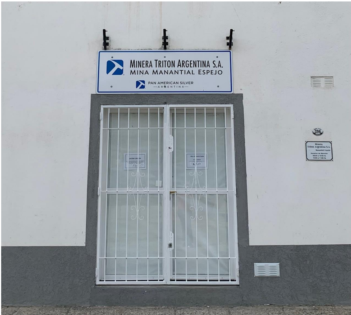
*Foto tomada en las oficinas cerradas de Triton, Gobernador Gregores (marzo 2023)

Universidad Nacional de la Patagonia Austral - Unidad Académica San Julián Centro de Investigación y Transferencia Santa Cruz (CIT-SC) Convenio UNPA-CONICET-UTN/FRRG